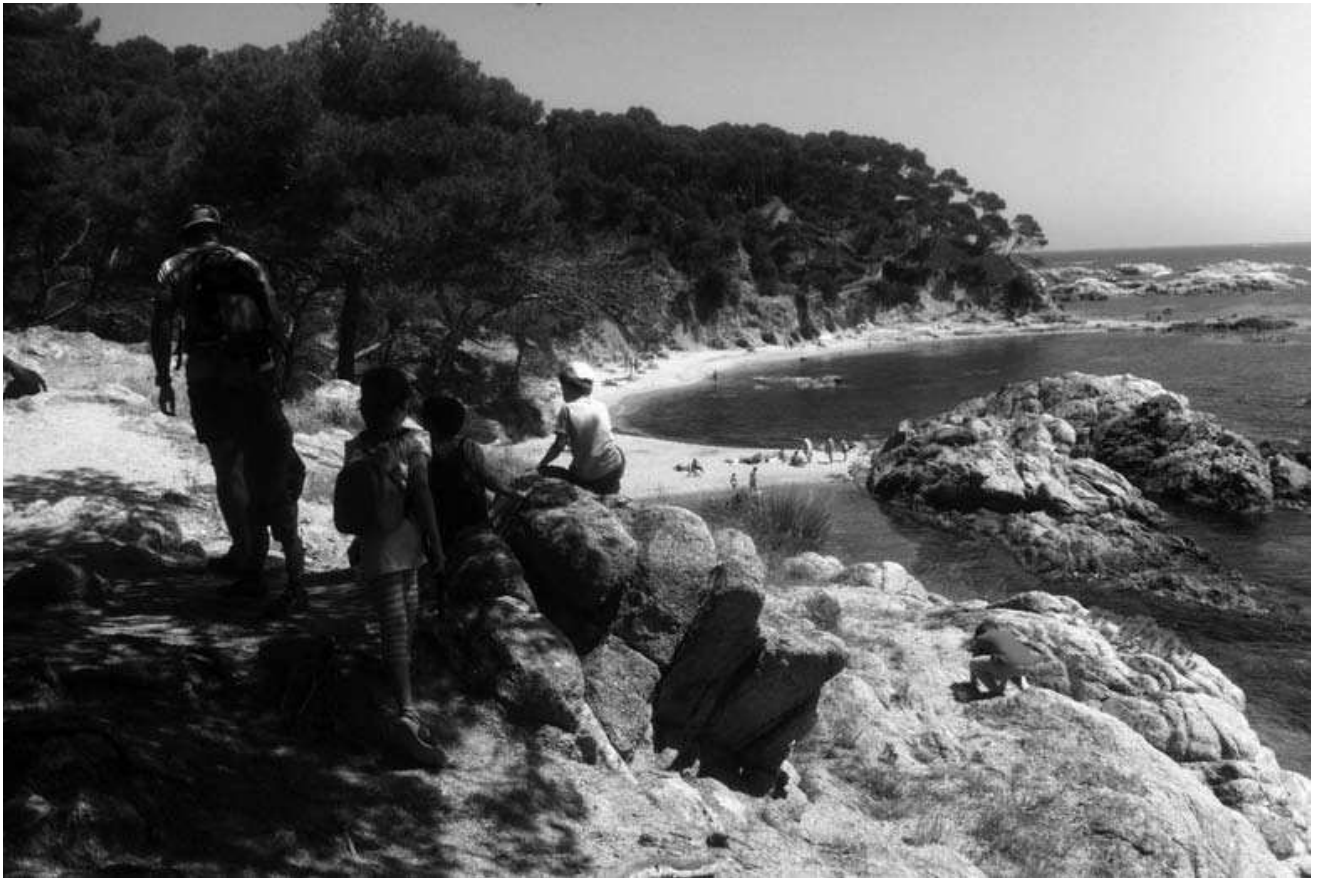
Arribant a cala Estreta

quesa...! Qui vol anar a Hawaii? Una excursió ben diferent a les que acostumem a fer.