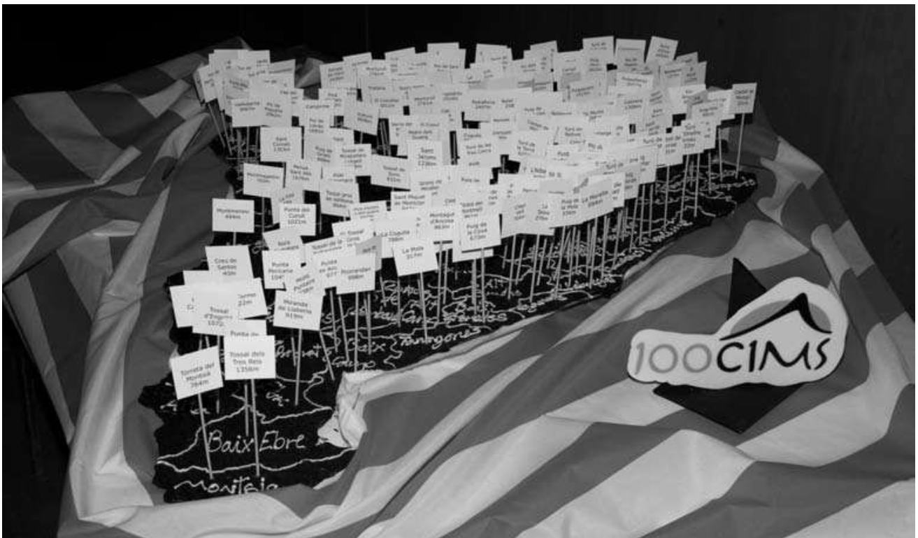
Pastís per a la IV trobada dels 100 CIMS