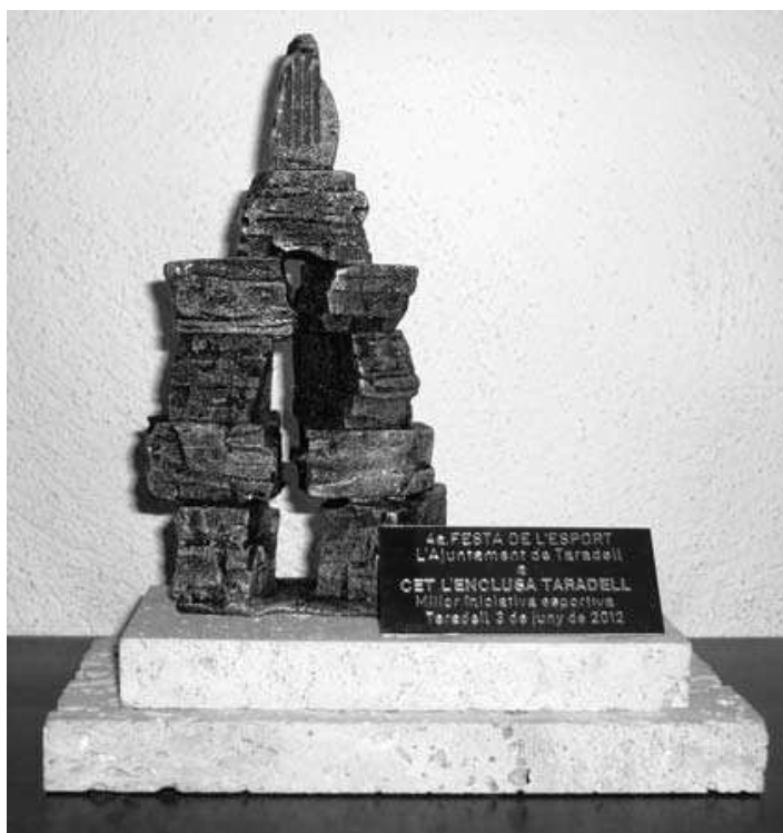
Trofeu que fou lliurat al CET l'Enclusa en la 4a Festa de l'Esport