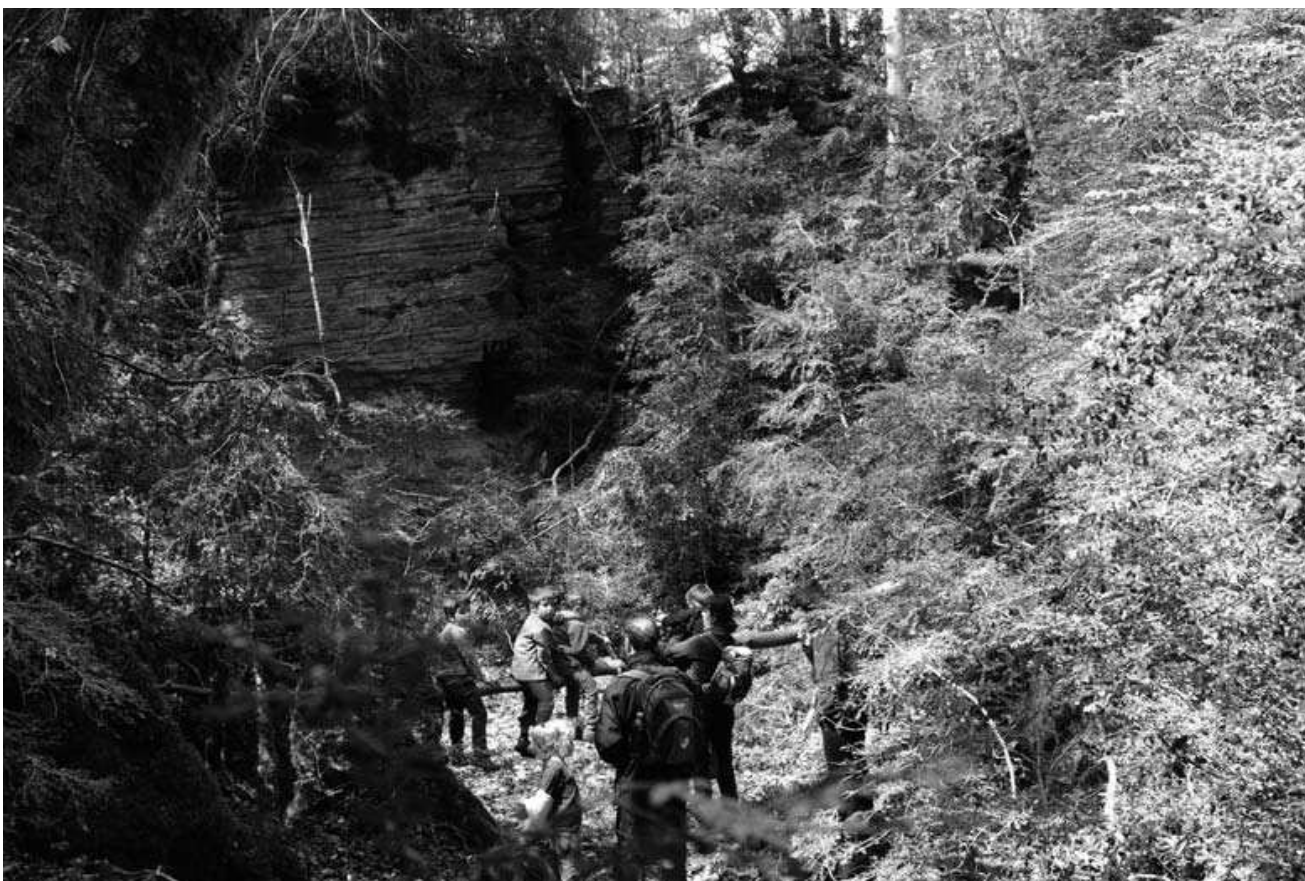
Sortida a les esquerdes de l'Euga. Racons fascinants

Camí de Ronda, entre la Fosca de Palamós i la Cala Estreta. Un tram de camí molt fresc, agradable i de gran bellesa que ens va oferir racons paradisiacs i va permetre més d'un bany. I quines cales amb aigües més cristal·lines de color tur-