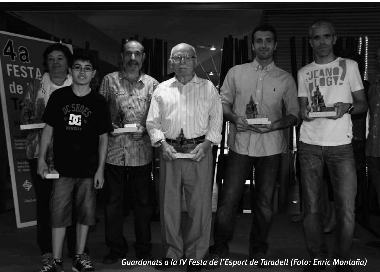
Guardonats a la IV Festa de l'Esport de Taradell