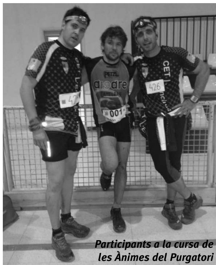
Participants a la cursa de les Ànimes del Purgatori

Si ets corredor i et vols preparar amb nosaltres tots els dimecres a 3/4 de 10 del vespre ens trobem a la parada de l'autobús de l'avinguda Sant Genis de Taradell per entrenar junts.