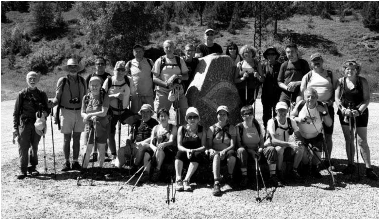
Grup que va participar a la sortida pel camí de la retirada