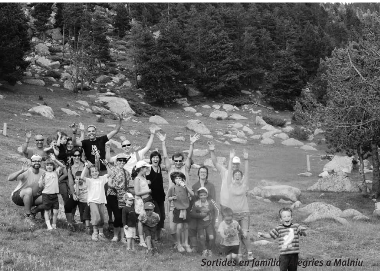
Sortides en família a Malniu