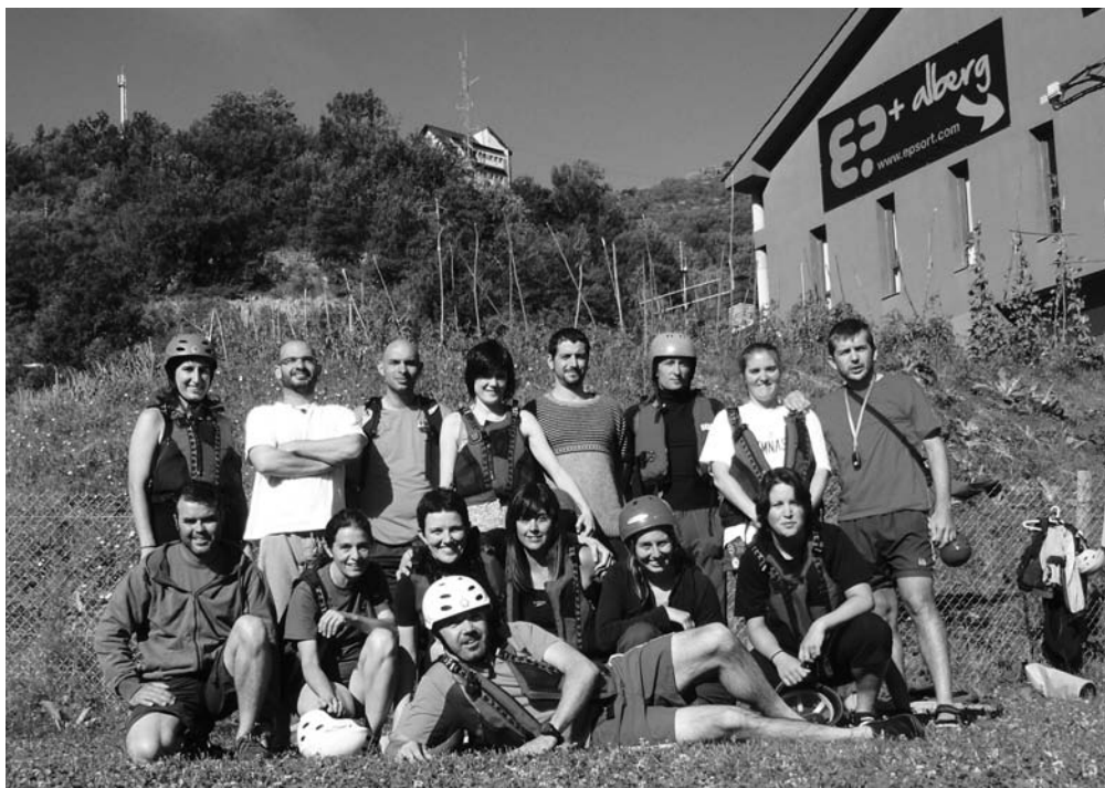
Participants del curs de piragüisme

Acabada la teoria va ser l'hora de passar a l'acció. El primer dia no vam anar al riu, sinó que ens vam quedar dins el recinte esportiu, en una espècie de piscina adequada per a l'aprenentatge. Cadascú va agafar el caiac que tenia assignat i el va posar a l'aigua. Després d'uns instants d'incertesa, a poc a poc vam anar guanyant confiança: de bon començament vam anar endavant i endarrere, després vam aprendre a girar. Lentament, vam anar perdent la por i aviat ens movíem lliurement i anàrquicament per tota la piscina, de manera