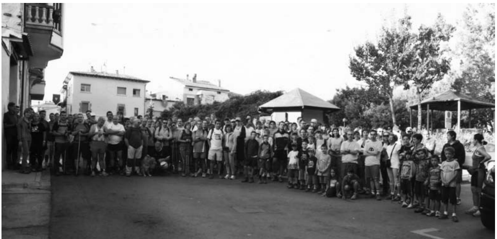
Sortida de la caminada de la Festa Major

El recorregut de la caminada va ser: plaça de les Eres, el Vapor, aquí van agafar el sender de petit recorregut en direcció cap a la Roca, van passar per la font del Ravató, l'Hostalet del Bou i la Trona fins a arribar a la collada de Mansa, on es donava l'esmorzar, a base de coca amb xocolata. Des d'aquí, van continuar seguint el sender cap al castell de Taradell i cap a la font del Castell. En el punt on el sender es troba amb el tancat de la Vallmitjana, van seguir el camí que voreja aquest tancat fins a la Serra i des d'allà van baixar cap a l'Institut, d'on van continuar cap al carrer Ramon Pou, per acabar la caminada al davant del local social del CET, on es servia un petit aperitiu als partici-